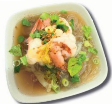
Bild: SU 3 mit Garnelen