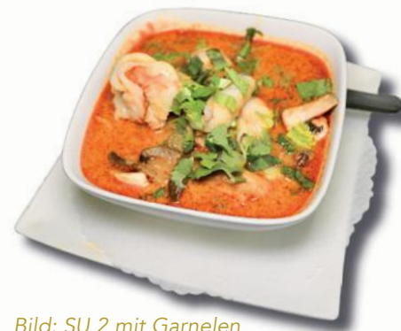
Bild: SU 2 mit Garnelen